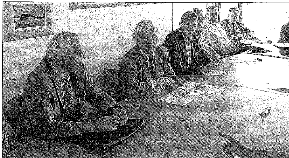
Les professionnels du trot ont pris part au débat sur le départ des Haras et la future arrivée de Genes diffusion sur le site de l'hippodrome.