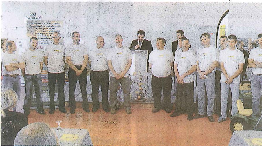
Les salariés de l'entreprise ont été mis à l'honneur.

La petite entreprise familiale a traversé les années et compte maintenant une vingtaine de salariés.