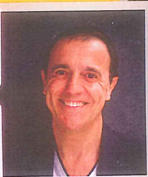
Avec le parrainage de Thierry Beccaro...